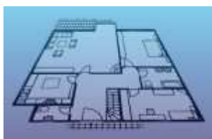
Engenharia e Arquitetura

Atua na análise e aprovação de projetos de Estabelecimentos de Educação Infantil, Estabelecimentos Manipuladores de Alimentos (Restaurantes, pizzarias, padarias, etc...) Estabelecimentos Assistenciais de Saúde (laboratórios clínicos, clínicas médicas, Odontológicas, Fisioterapias , veterinárias, Comunidades Terapêuticas, Instituições de longa Permanência de Idosos e outras), Farmácias de manipulação, Estabelecimentos de Hospedagem (hotéis, motéis).